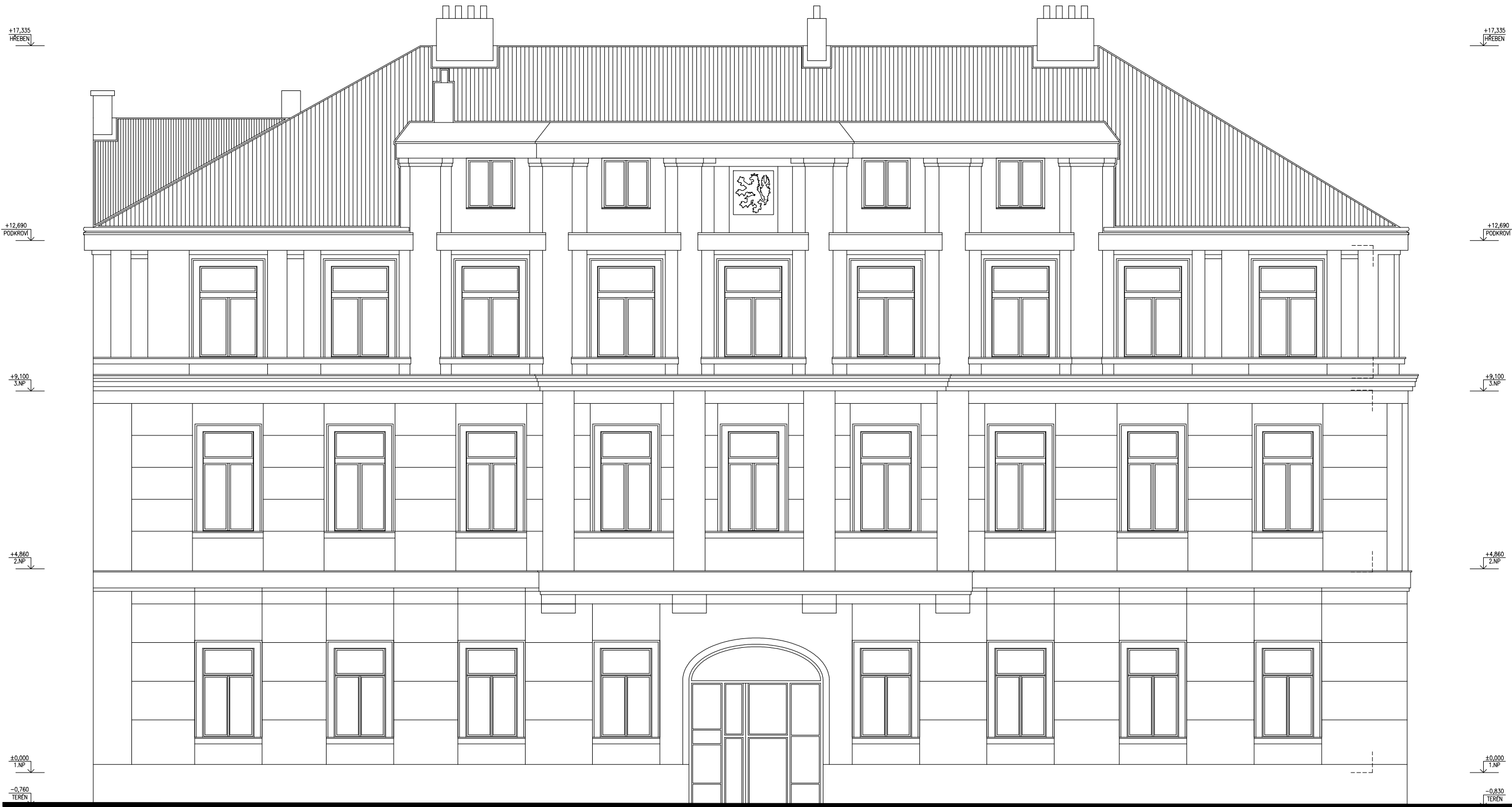
POHLED 2 – JIHOZÁPADNÍ (ULIČNÍ) FASÁDA